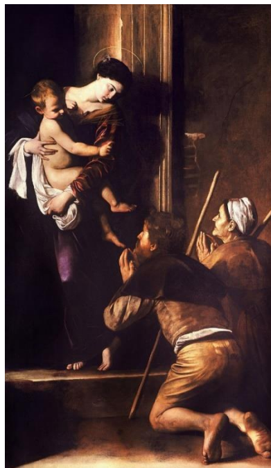
Bild 7. Madonnan från Loreto , 1604-1605

En annan kyrkomålning som jag emellertid kunde se var Madonnan från Loreto (Bild 7) i pilgrimskyrkan Sant'Agostino. 24