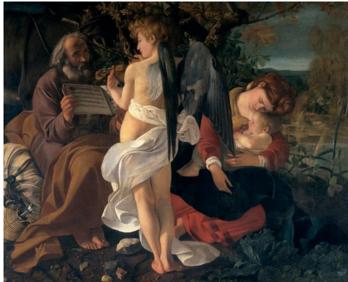
Bild 4. Vilan under flykten till Egypten , 1596-97