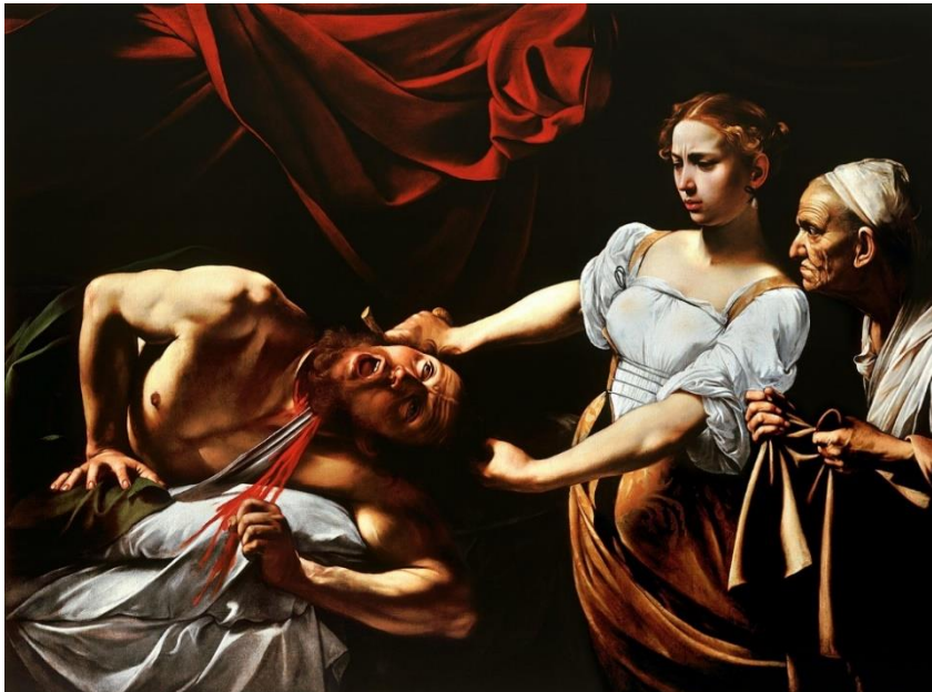
Bild 1. Judit halsbugger Holofernes , cirka 1599

Framför Caravaggios målning Judit halsbugger Holofernes (Bild 1) i museet Palazzo Barberini i Rom är klungan av besökare tät och på golvet nedanför tavlan sitter en hel skolklass och antecknar i sina block. För att nå tavlan får man försiktigt tränga sig fram. Det finns många andra tavlor på museet, men de röner inte samma uppmärksamhet. Vad är det då som gör Caravaggios målning så speciell? Det finns omfattande forskning om Caravaggio. Otaliga artiklar och böcker om hans konst och liv har skrivits, men inget går upp emot att själv beskåda hans verk i original, något jag fick möjlighet att göra vid ett besök i Rom. Erfarenheterna av detta är bakgrunden till denna artikel. Jag kommer att utgå från målningen Judit halsbugger Holofernes och försöka förstå varför den och andra senare målningar av Caravaggio fortfarande fascinerar och påverkar oss som betraktar dem.