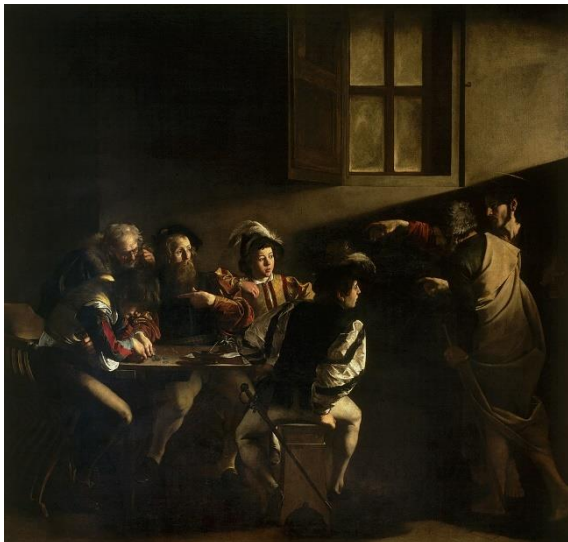
Bild 5. Mattus kallelse , 1599-1600

I Contarelli-kapellet i kyrkan San Luigi dei Francesi finns två målningar vilka däremot innehåller stor dramatik. De avbildar dessutom, till skillnad från Caravaggios tidigare verk, ett större antal personer. Caravaggio fick år 1599 i uppdrag att utföra de två målningarna. De skulle avbilda Matteus kallelse (Bild 5) och Matteus martyrskap (Bild 6).