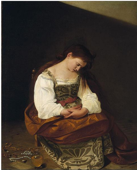
Bild 3. Maria Magdalena , 1595-96

En annan skillnad är valet av motiv. I Spåkvinnan är motivet icke-religiöst. Caravaggio kom emellertid att bli mest uppskattad för sina religiösa målningar. De första av dessa utförde han på uppdrag av privata samlare. I museet Galleria Doria Pamphilj hänger två av dessa målningar bredvid varandra: Maria Magdalena (Bild 3) och Vilan under flykten till Egypten (Bild 4). 10